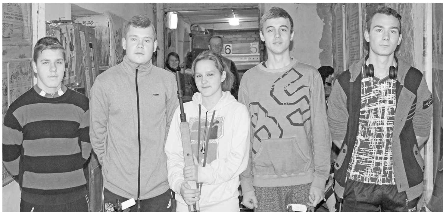
Сборная команда Хотьковской школы (серебряные призёры).