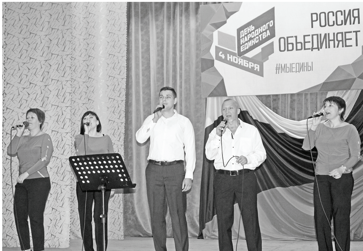
Выступает ансамбль «Мелодия».