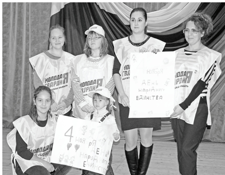
Участие в празднике приняли думиничские «Молодогвардейцы».