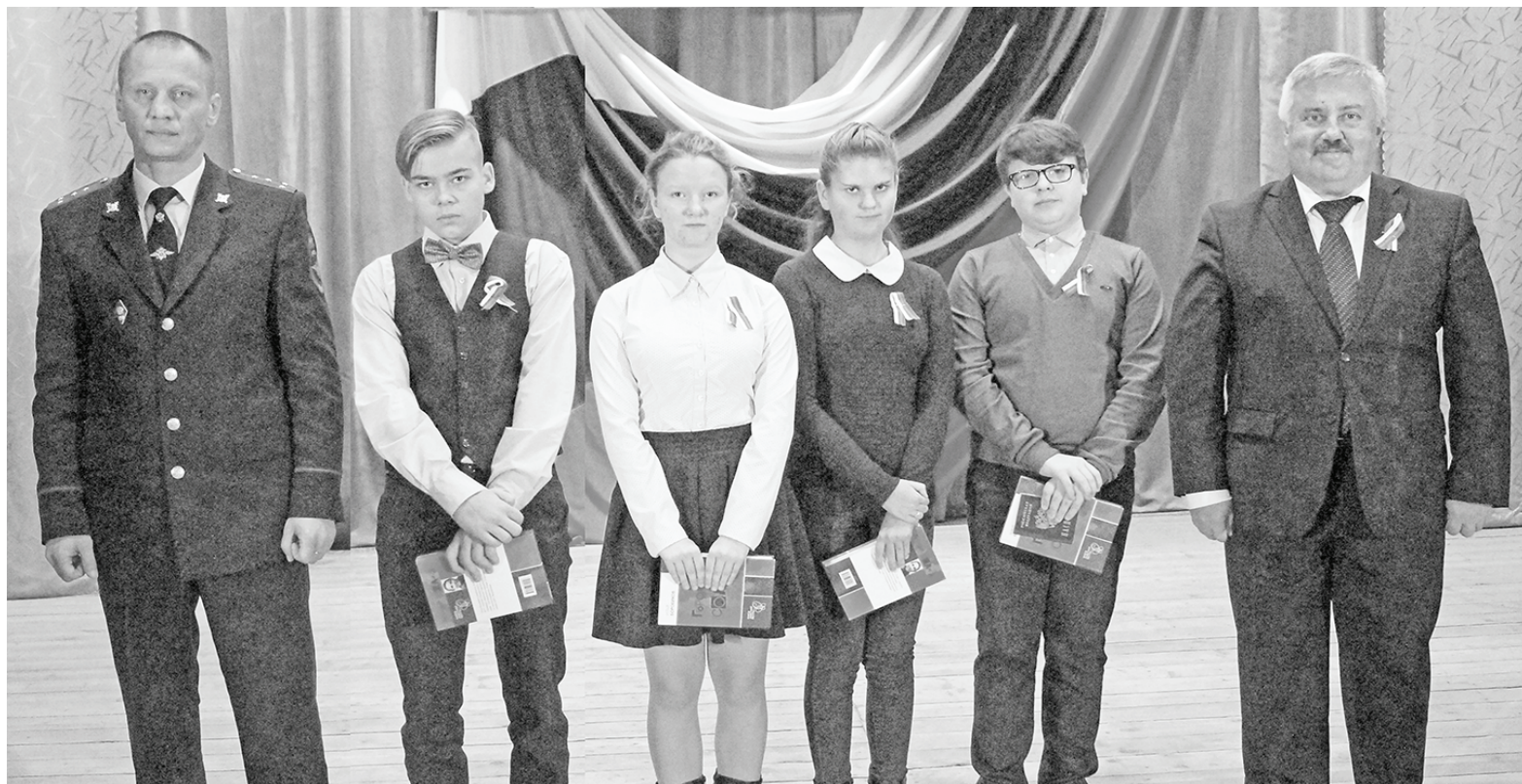
Юные граждане получили паспорта.